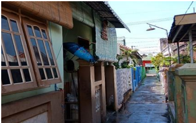
Jl. Karanganyar No. 213