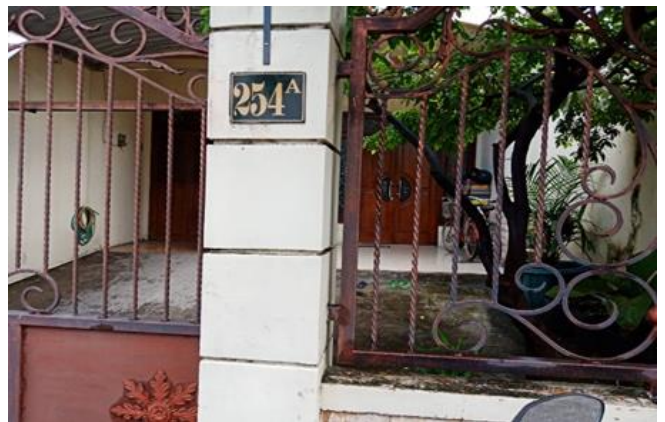
Jl. Karanganyar No. 254