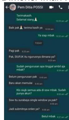
PT Power System Service Indonesia