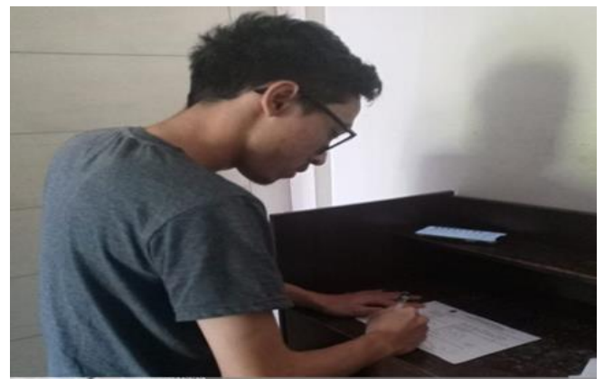
PT Gunung Gedangan Makmur Jl. Ketintang Permai Blok BD - 3