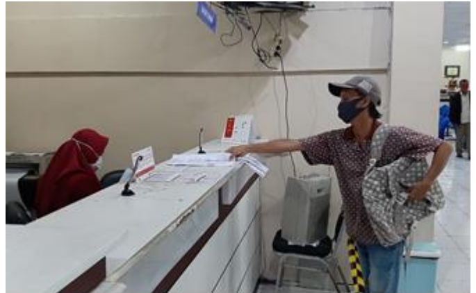
Pelayanan Loker Bank Jatim