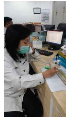
PT Dimensi Iman Hidup