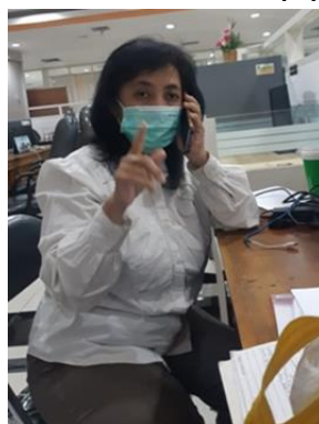
PT Bintang Andalan Sukses

Jumlah Perusahaan yang Diberikan Asistensi Online Sebanyak 5 Perusahaan