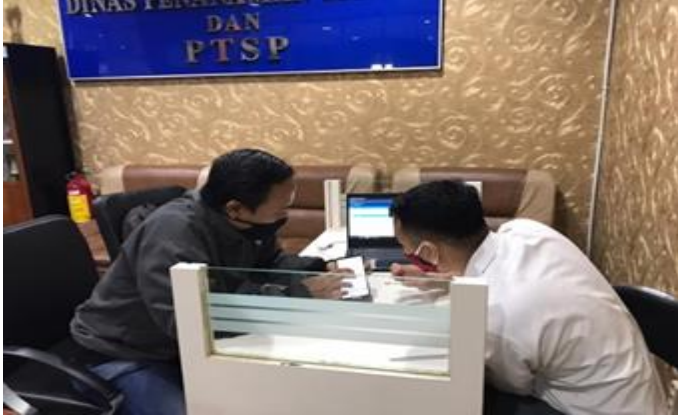
PT Graha Aspindo Perkasa