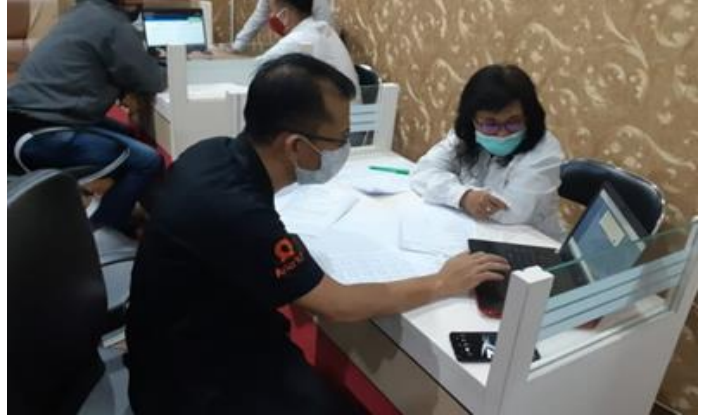
PT Bintang Anugrah Persada (Aria Hotel)

Jumlah Perusahaan yang Diberikan Asistensi Sebanyak 2 Perusahaan