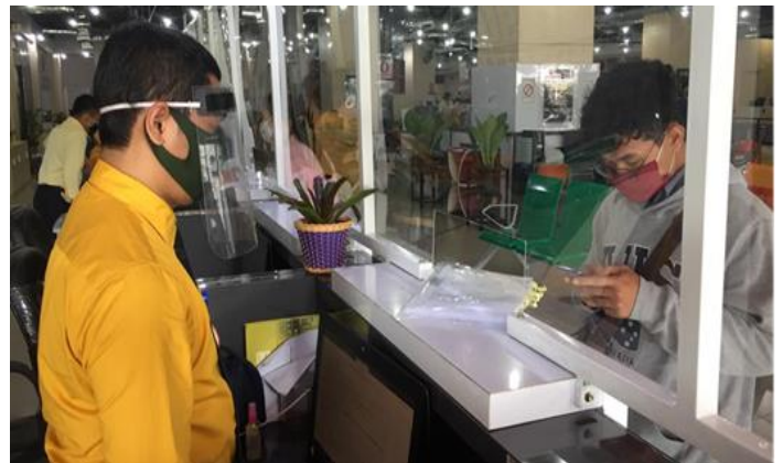
Pelayanan Loker Mandiri

Jumlah Permohonan Perizinan Yang Masuk Sebanyak 107 Berkas