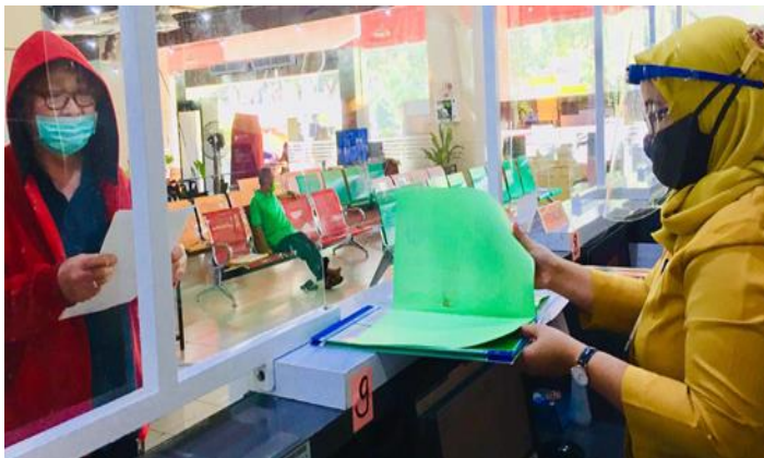
Pelayanan Loker Customer Services