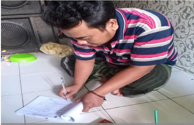
Nempel Jaya Jl. Simo Gunung Kramat Timur VII / 35