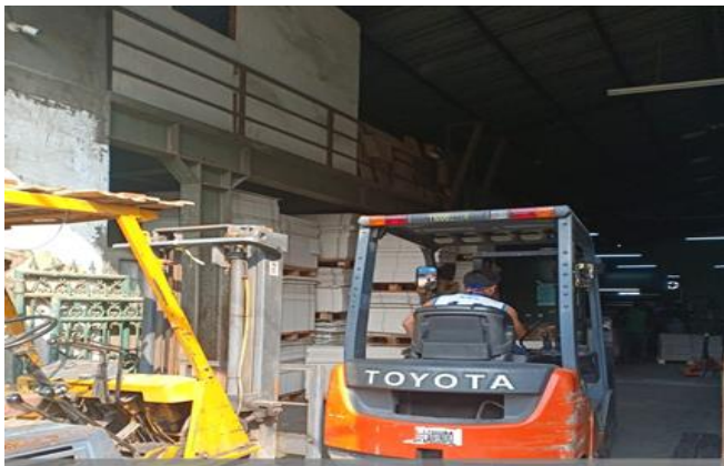
CV Super Lamindo Jl. Tanjungsari 44 / B - 11