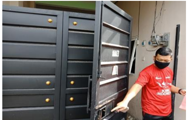
Jl. Karanganyar No. 206B