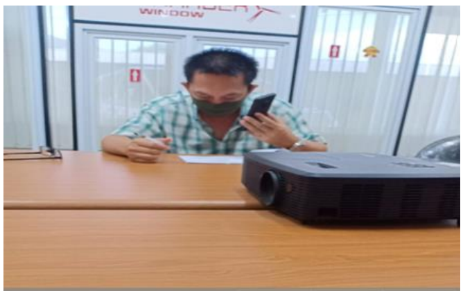
PT Ciptapola Kharisma Jl. Kenjeran No. 86