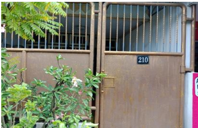
Jl. Karanganyar No. 210