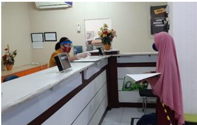
Pelayanan Loker Customer Service