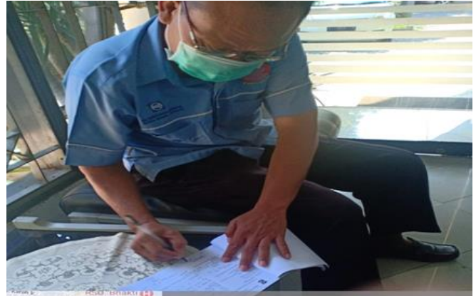
CV Hasta Karya Muda Jl. Ketintang Selatan No. 115