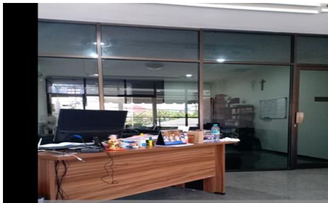
CV Indo Fortune Hendel Jl. Darmo Baru Barat IV / S-15