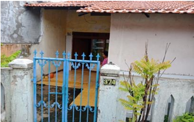
Jl. Pulosari No. 374